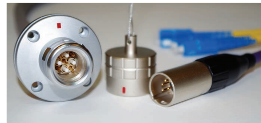
Разделанная на разъёмы кабельная сборка Wiring Parts FXG.4K.95D. Bio Set

На блоках серии 4 Installations могут быть смонтированы разъёмы различных серий с посадочным типоразмером D – XLR, PowerCon, Speakon, Ethercon, OpticalCon, BNC с D-фланцем. Кроме них, можно установить любые другие, нестандартные или уникальные разъёмы, сочетающиеся с конструкцией несущего их блока и согласованные с конструкторами Wiring Parts. Разъёмы устанавливаются на па-