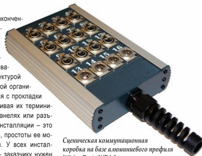
Сценическая коммутационная коробка на базе алюминиевого профиля Wiring Parts WPA L+

избегать механических ошибок, а инженерам эксплуатации – разобраться в хитросплетениях входящих и исходящих кабелей.