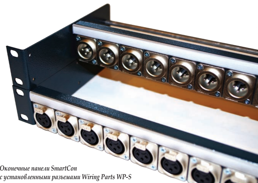
Оконечные панели SmartCon с установленными разъемами Wiring Parts WP-S

Далее, установочные элементы – оконечные 19" панели разъёмов – имеют технологичную модульную конструкцию, их можно трансформировать по глубине, они снабжены информационными табличками (кабель-трассером и компонентной) для маркировки разъёмов. Все панели характеризуются повышенной механической прочностью и выполняют сразу две функции – служат оптимальным решением для организации кабелей и одновременно оконечными коммутационными панелями. Применение панелей в проектах значительно сокращает время установки и упрощает последующую эксплуатацию системы. Они имеют высокую плотность разъёмов – до 16 на панелях высотой 1U и до 32 на панелях 2U, что крайне важно при установках мо-