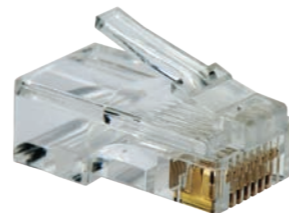
Штекер RJ45 8P8C

разработок системных разъемов, сделанных впоследствии разными производителями.