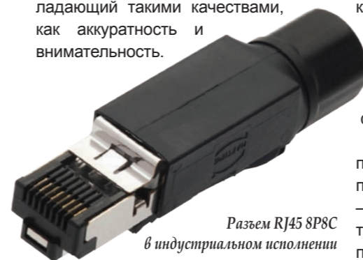
Разъем RJ45 8P8C в промышленном исполнении

Существует несколько основных типов разъемов RJ45 8P8C, оптимизированных для различных типов кабеля. Они различаются размерами внутренних элементов в зависимости от диаметра кабеля, а также формой ножей контактов для одножильных или многожильных кабелей. Монтаж разъемов очень прост, благодаря чему разъемы может смонтировать любой технический специалист, прошедший 10-минутный тренинг у мастера и обладающий такими качествами, как аккуратность и внимательность.